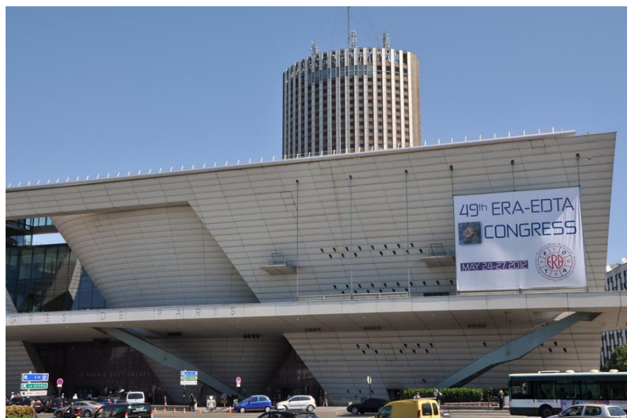
Rycina 1 Pałac Kongresowy w Paryżu. Congress Palace in Paris.